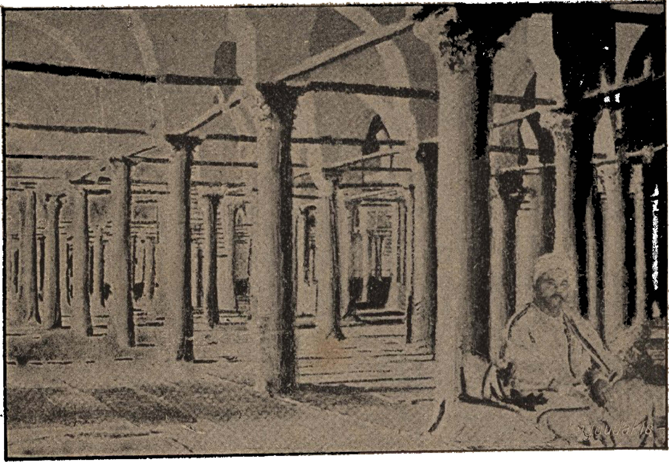
❖ صورة تمثل ( ابن رشد ) في احد جوامع قرطبة ❖